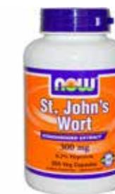
حبوب نبتة سانت جون