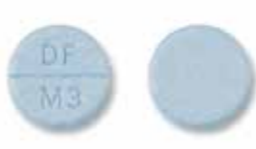
ماريقان ٣ مليجرام (حبة دائرية زرقاء)