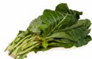
اللّخن أو شبیه الملفوف