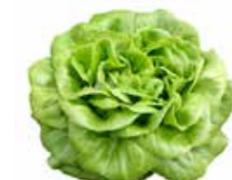
الخس الكروي أو الصيني