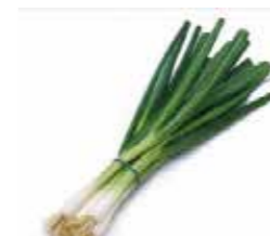
بصل الربيع أو البصل الأخضر