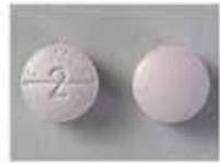
كومادين ٢ مليجرام (حبة دائرية ارجوانية)