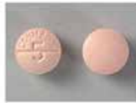
كومادين ٥ مليجرام (حبة دائرية وردية فاتح)