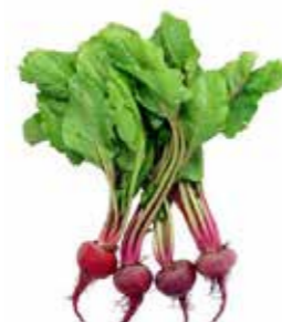
ورق الشمندر أو البنجر