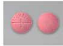
كومادين ١ مليجرام (حبة دائرية وردية)

كل الأنواع التجارية تحتوي على المادة الفعالة ( الوارفارين ) بينما الاختلاف يكون في المواد الأخرى المستخدمة لتكوين الشكل النهائي للحبوب، قد يؤثر استخدام أنواع تجارية أخرى من الوارفارين إلى تغيير في مستوى سيولة الدم، لذلك فإنه ينصح باستخدام نوع ثابت، وفي حالة تغيير النوع يرجى استشارة الطبيب أو الصيدلي المتابع لحالتك.